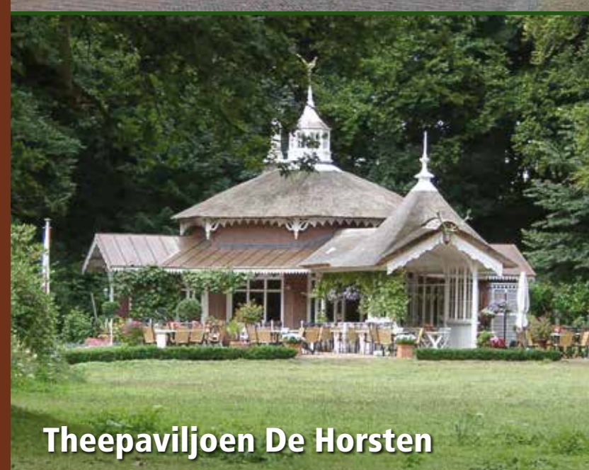
Theepaviljoen De Horsten